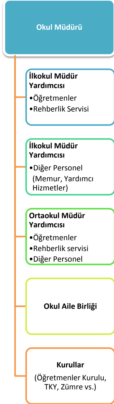
Őekil 1: Zübeyde Hanım İlkokulu/Ortaokulu Müdürlüğü TeŐkilat Őeması